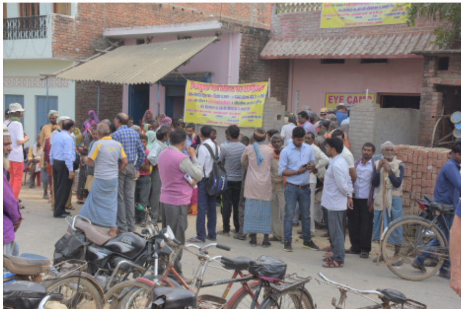
Schlangestehen für einen Arzttermin

Bei der Jubiläumsreise der REHASWISS im November 2017 hatten wir die Gelegenheit, bei einem Eyecamp in der Umgebung von Allahabad dabei zu sein. Noch heute erinnere ich mich an diesen Tag. Vor Ort erlebten wir 1:1 ein Projekt, das von der REHASWISS regelmässig unterstützt wird.