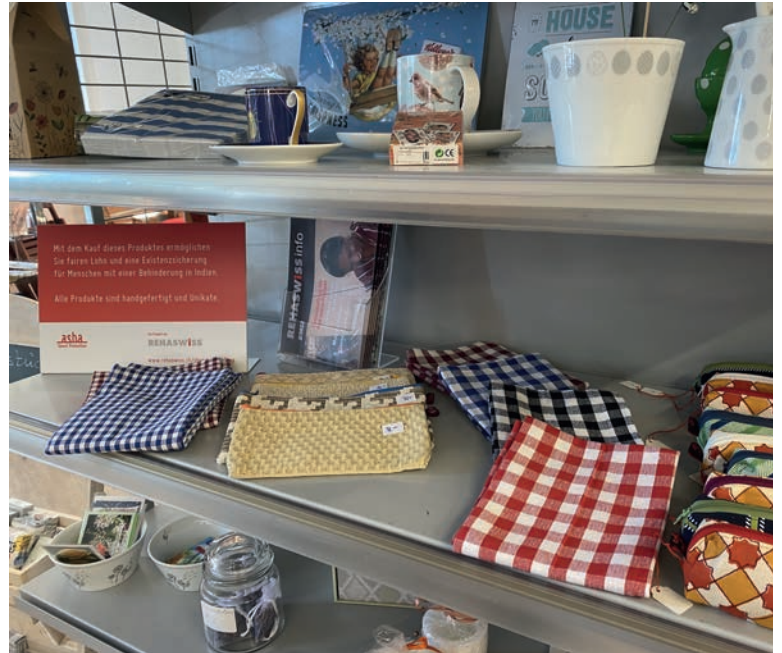
Ein Blick ins asha-Ausstellungsregal im Möösli Märli.

Der Lebensmittelladen in 3037 Herrenschwanden, in der Nähe von Bremgarten bei Bern, ist täglich geöffnet, auch an Samstagen und Sonntagen.